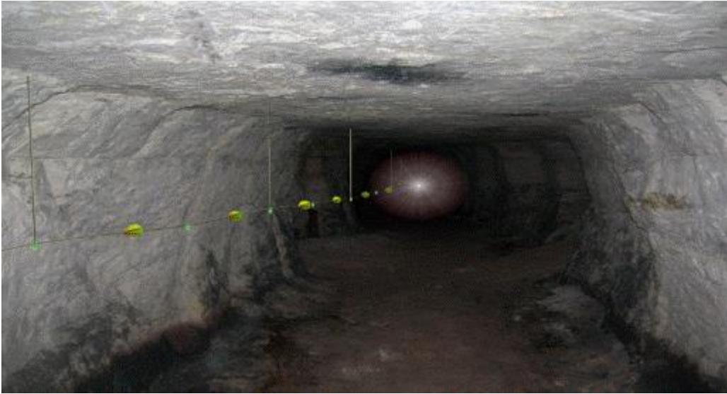
Şekil-1: Hayat hattı görünümü

18. (Ek:RG-10/3/2015-29291) (3) Yeraltı madenlerinde, hazırlık faaliyetlerinin yapıldığı alanlar ve üretim panoları gibi yeraltı maden işletmesinin bütün bölümlerini kapsayacak şekilde ve çalışanların yerüstüne çıkmalarını kolaylaştıran; yanmaya, kopmaya ve aşınmaya karşı dayanıklı bir hayat hattı kurulur (Şekil-1 ve Şekil-2). Bu hatlar acil durum planlarına uygun olarak yerleştirilir.